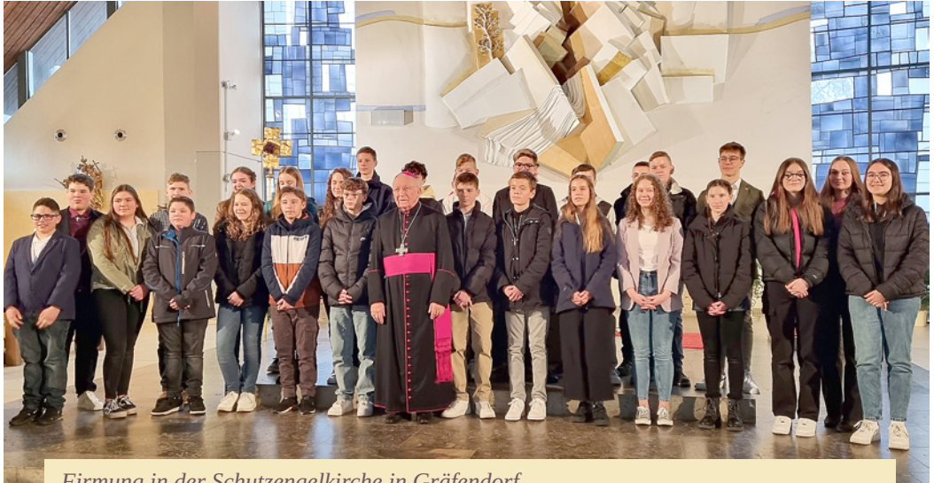
Firmung in der Schutzensengelkirche in Gräfendorf durch Weihbischof Ulrich Boom (mitte)