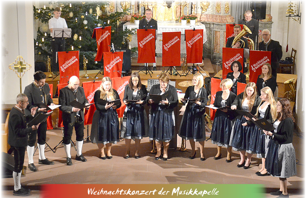
Weihnachtskonzert der Musikkapelle