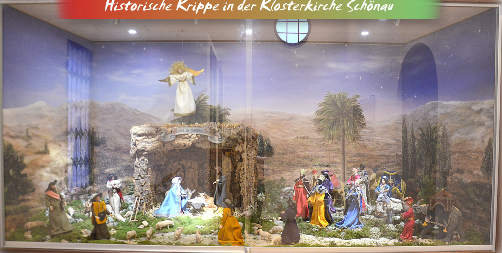
Historische Krippe in der Klosterkirche Schönaau