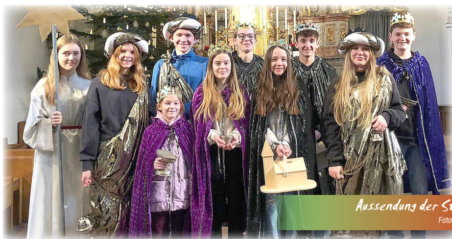
Aussendung der Sternsinger