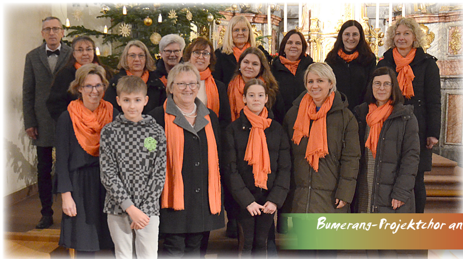
Bumerang-Projektchor an Hl. Abend