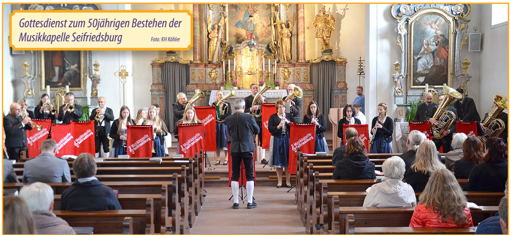
Gottesdienst zum 50jährigen Bestehen der Musikkapelle Seifriedsburg